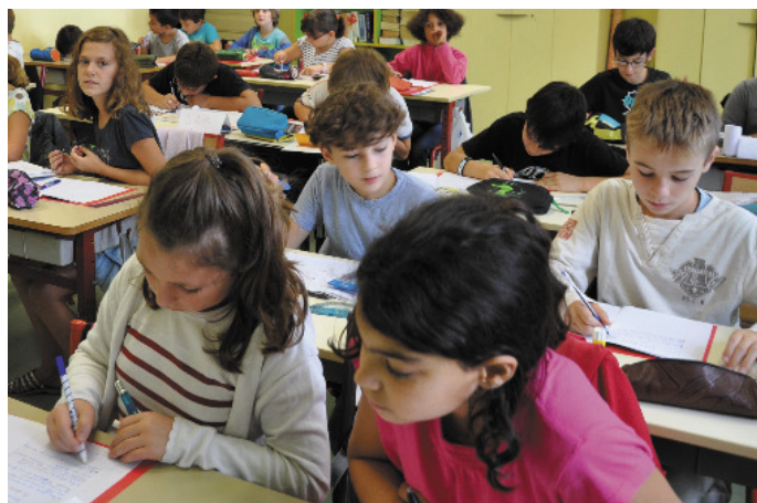
Une rentrée studieuse