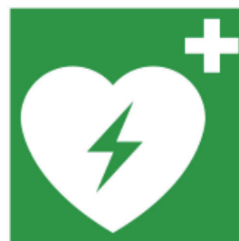
Logo indiquant la présence d'un défibrillateur

La défibrillation précoce associée à la réanimation cardio-pulmonaire augmente fortement les chances de survie d'une personne en arrêt cardio-respiratoire, principale cause de mort subite chez l'adulte.