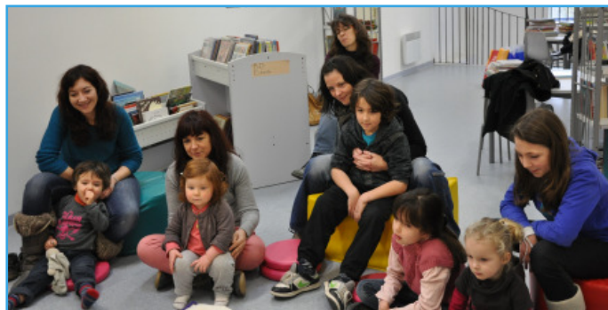
Bébés lecteurs, tout un petit monde attentif.

Tel : 04.68.24.62.79, lecture@piege-lauragais.fr