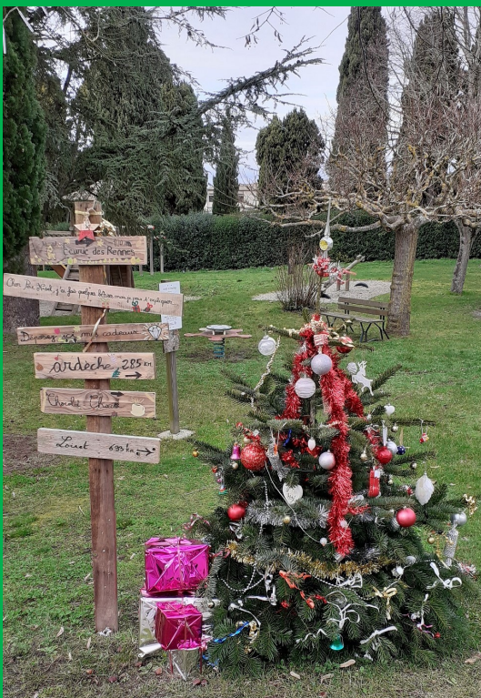
Le sapin d'Or 2020 !