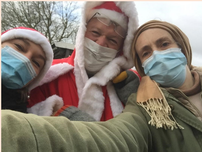
Hé oui, même le Père Noël était présent !