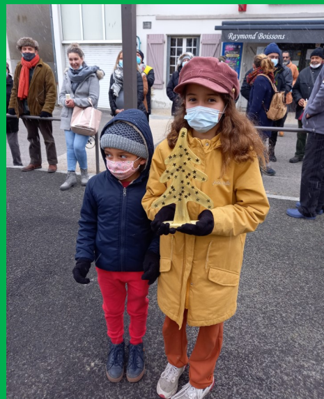
Les Lauréats sous la neige !