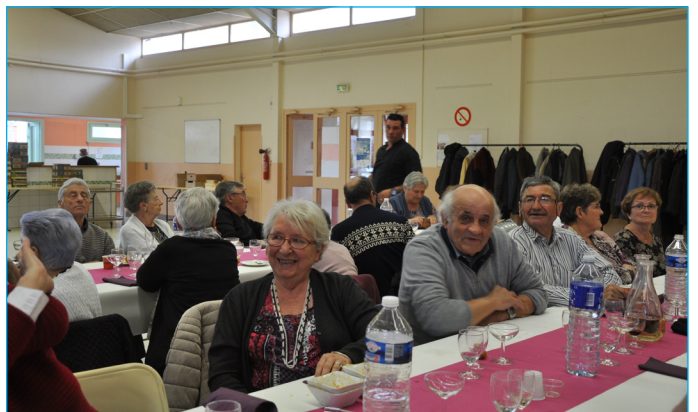
Après l'AG, l'amicale du troisième Age se régale de bons petits plats.

Un bruitage du plus bel effet, parents, enfants, spectateurs tous unis dans un orchestre improvisé.