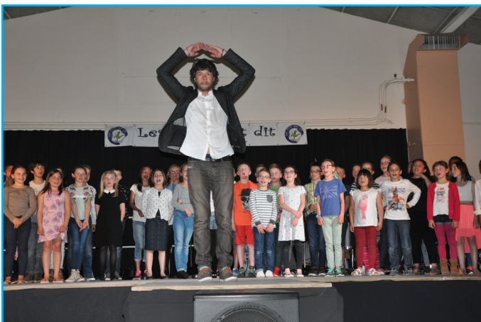
Une séance de «Sound Painting»

Avec les écoles de Fanjeaux, Villegly, et Pexiora. Le public a été impressionné par la prestation des enfants et a participé volontiers en répondant à la gestuelle du chef d'orchestre.