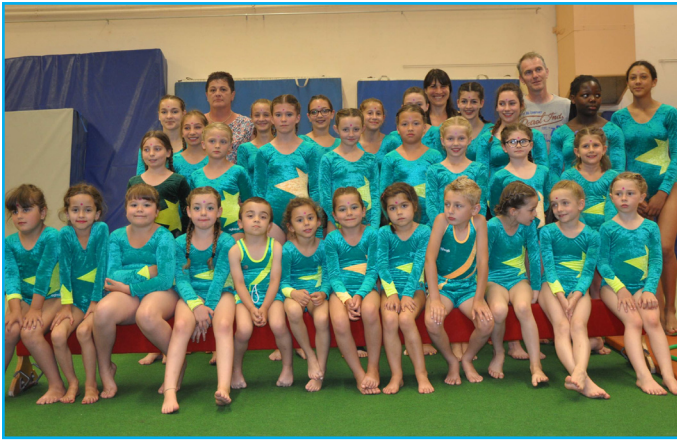
La Fanjuvéenne, société de gymnastique créée en 1959, accueille une quarantaine d'enfants et autant d'adultes toute l'année, la fête de juin est l'occasion de les réunir sur les tapis.