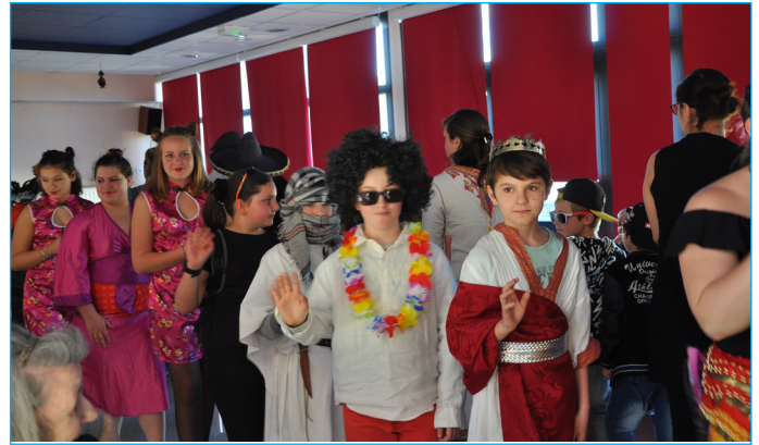
Le Carnaval, met en scène, les Familles Rurales, le Comité des fêtes et passe par la Maison de retraite