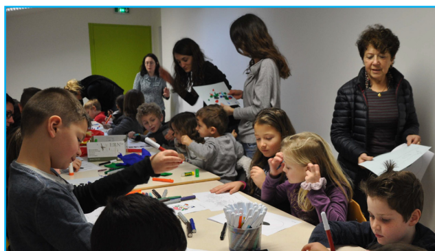
La médiathèque : c'est pour les petits et les grands

ou par téléphone au 06 78 27 19 33 ou au 06 89 49 09 48.