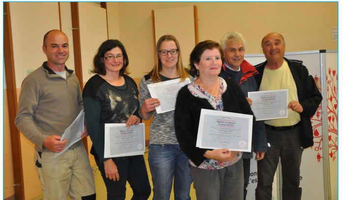
Une remise de diplômes chez les donneurs de sang