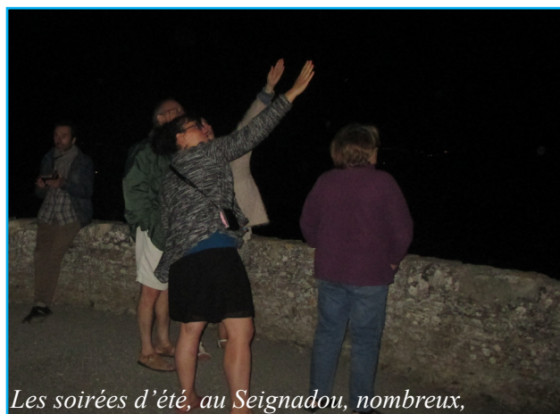
Les soirées d'été, au Seignadou, nombreux, sont ceux qui viennent admirer le ciel étoilé.