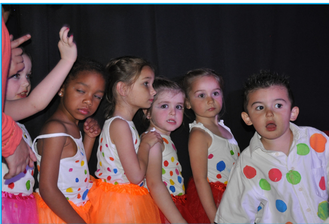
Les Petits pas» des Familles Rurales, inquiets avant de monter sur scène, lors du spectacle «Une année avec les Fanjo-Tonics»