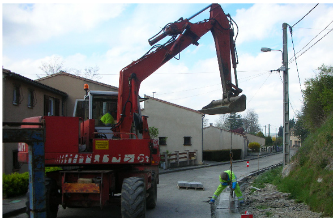
La chaussée et les trottoirs de l'avenue de la gare en cours de réfection.